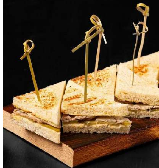
МИНИ СЭНДВИЧ С БУЖЕНИНОЙ И КОРНИШОНАМИ