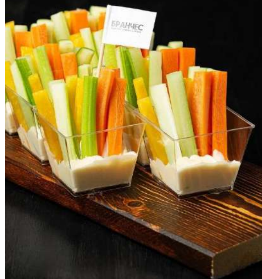
КРУДИТЕ ИЗ СВЕЖИХ ОВОЩЕЙ С СОУСОМ ИЗ СЫРА ДОР БЛЮ