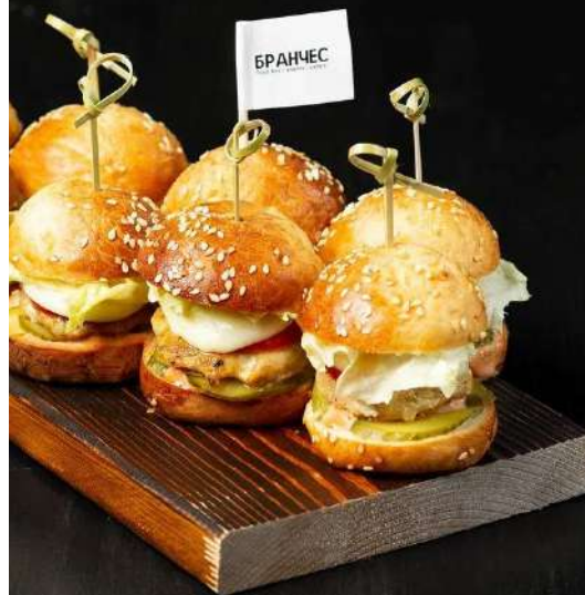
МИНИ БУРГЕРЫ С КУРИНОЙ КОТЛЕТОЙ