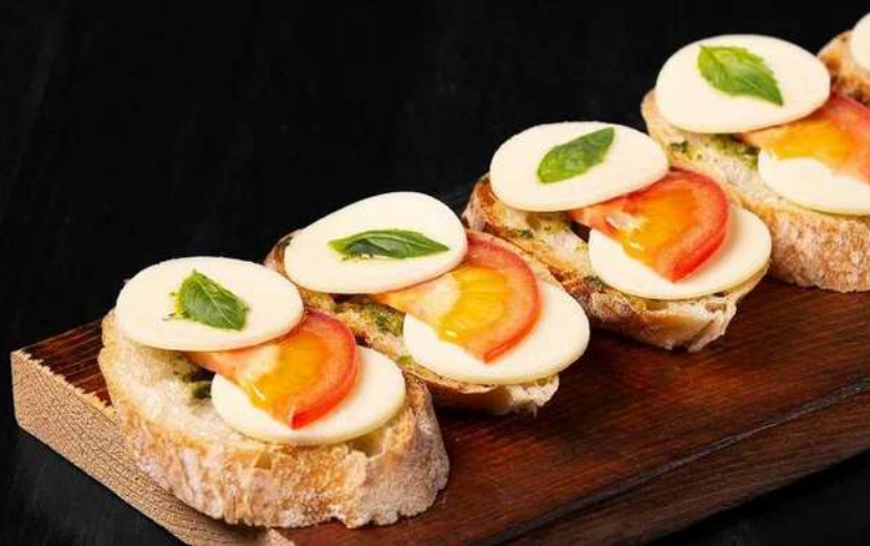
БРУСКЕТТА С МОЦАРЕЛЛОЙ, ТОМАТАМИ И ПЕСТО