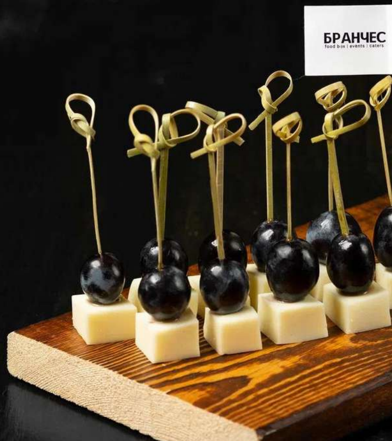
КАНАПЕ С ТВЕРДЫМ СЫРОМ И СОЧНЫМ ВИНОГРАДОМ