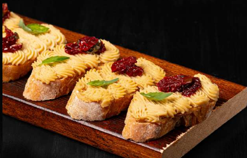
БРУСКЕТТА С ДОМАШНИМ ХУМУСОМ И ВЯЛЕНЫМИ ТОМАТАМИ