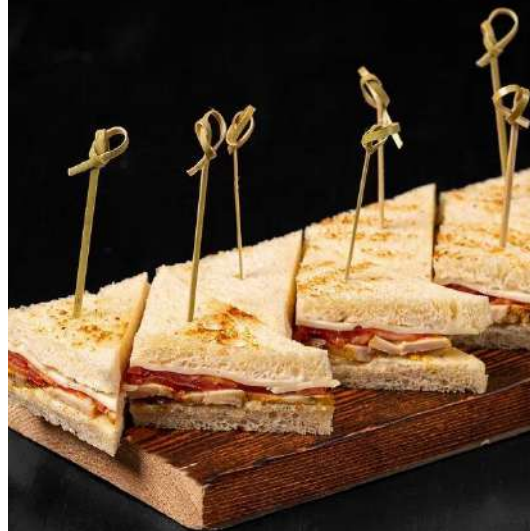
МИНИ СЭНДВИЧ ЦЕЗАРЬ С КУРИЦЕЙ