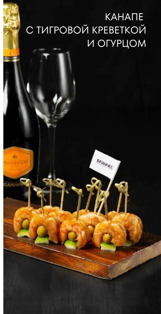
КАНАПЕ С ТИГРОВОЙ КРЕВЕТКОЙ И ОГУРЦОМ