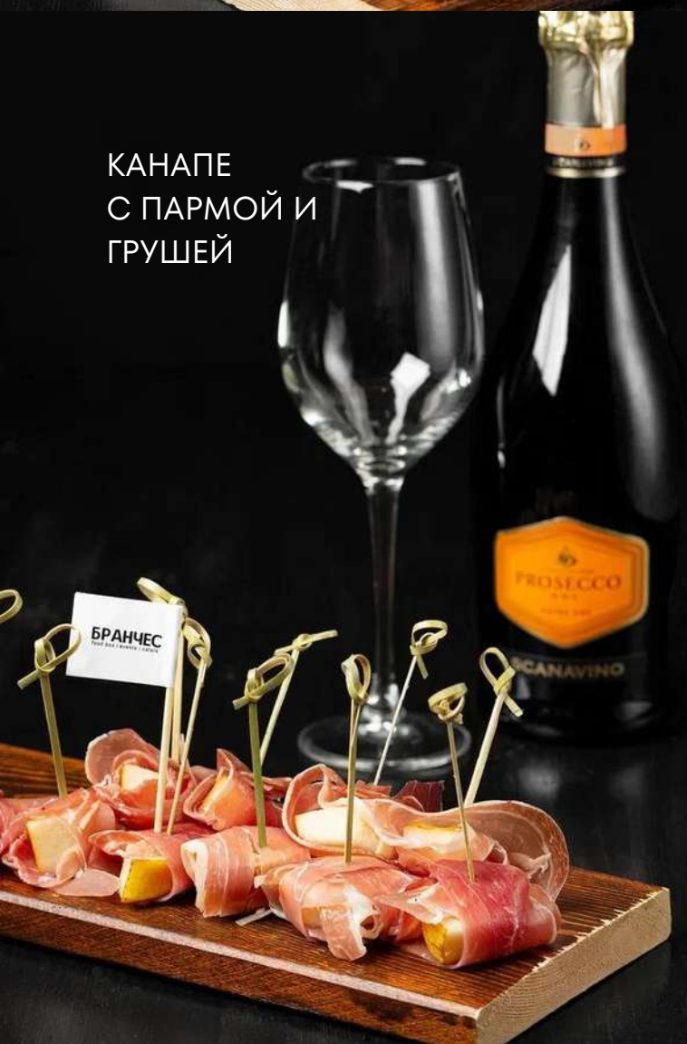
КАНАПЕ С ПАРМОЙ И ГРУШЕЙ