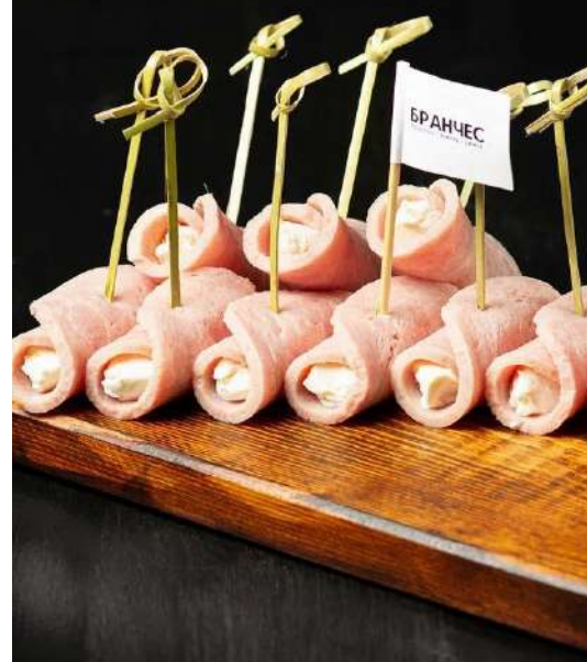
РУЛЕТКИ С ВЕТЧИНОЙ, КРЕМ ЧИЗОМ И ЗЕЛЕНЬЮ