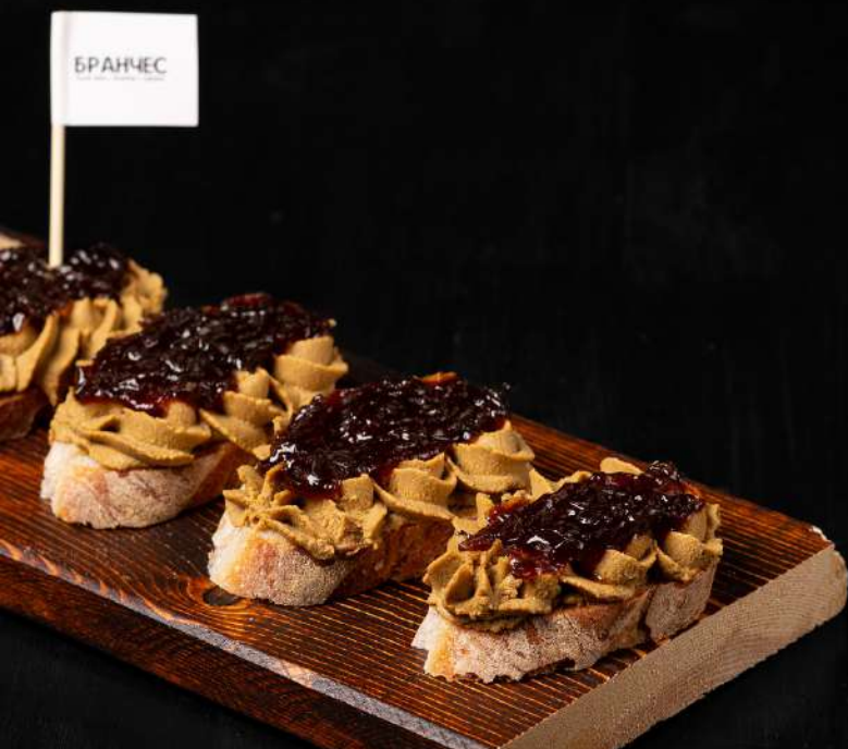
БРУСКЕТТА С НЕЖНЫМ КУРИНЫМ ПАШТЕТОМ И ЛУКОВЫМ КОНФИТЮРОМ