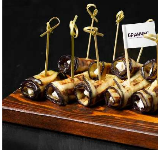
РУЛЕТКИ ИЗ БАКЛАЖАНОВ, СЫРА И ГРЕЦКИХ ОРЕХОВ