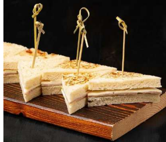
МИНИ СЭНДВИЧ С ВЕТЧИНОЙ И СЫРОМ