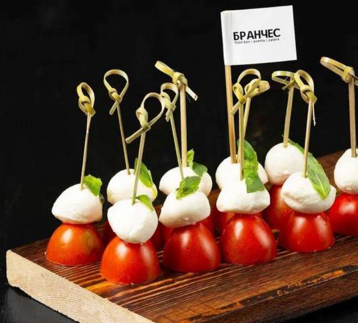
КАНАПЕ С МИНИ МОЦАРЕЛЛОЙ, ТОМАТАМИ И ПЕСТО