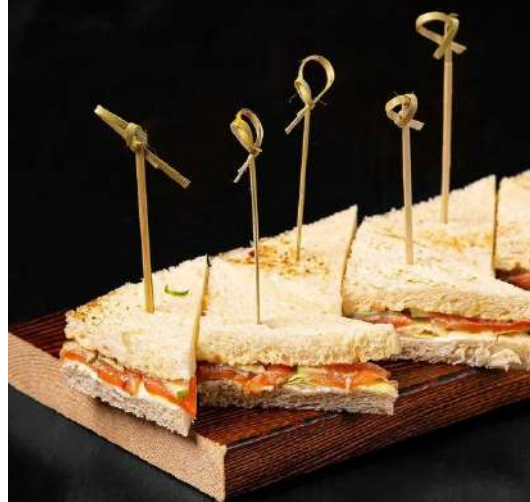
МИНИ СЭНДВИЧ С КРАСНОЙ РЫБОЙ, СЛИВОЧНЫМ СЫРОМ И ОГУРЦОМ